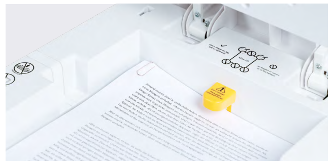
Vernichtet auch Dokumente mit Büro- und Heftklammern.