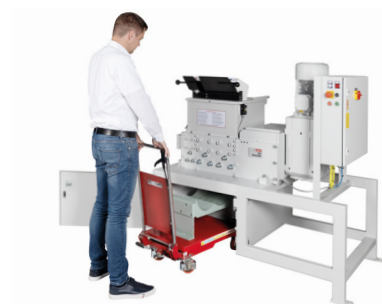
Changement d'écran simple et facile