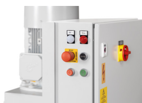
Commande par boutons-poussoirs faciles à comprendre