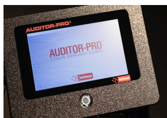
Erstellt Löscherichte – Bedienung über Touchscreen