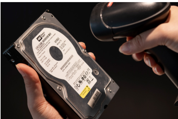
Scannt Seriennummern von Festplatten vor der Löschung