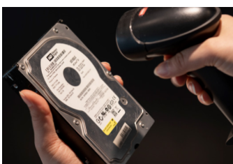
Scantt Seriennummern von Festplatten vor der Löschung