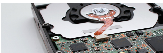
Borrado seguro y completo de datos en discos duros