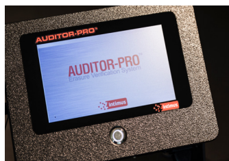
Creación de informes de borrado - Funcionamiento mediante pantalla táctil