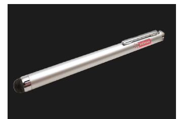
Lápiz óptico para manejar cómodamente la pantalla táctil