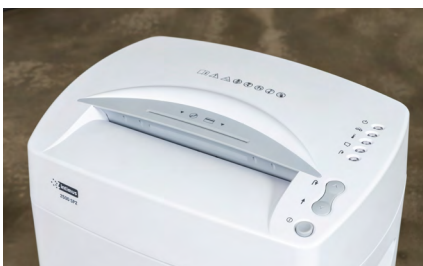
Funcionamiento intuitivo gracias a teclas de función y pantalla LED.