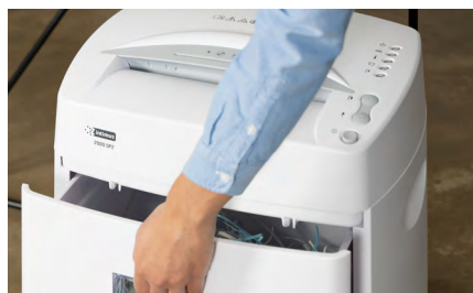
Papelera extraíble de 32 litros para facilitar su eliminación.