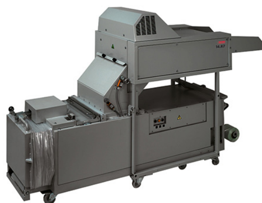
W/D/H 268/327 x 80 x 164 cm

Depuis des décennies, les destructeurs industriels intimus® sont des acteurs majeurs de la destruction des medias supports de données sur la vie privée. La gamme offre des modèles permettant de gérer jusqu'à 550 feuilles/h, comme des dossiers complets, en une seule opération. La grande table d'alimentation avec tapis roulant d'alimentation intègre un chargement contrôlé, sans effort, sûr et rapide. Le matériau ainsi détruit est recueilli dans des conteneurs mobiles ou pivotants de grande capacité au-dessous du mécanisme de découpe. Les combinaisons déchiqueteuse-presse sont couplées à une presse à balles pour un compactage entièrement automatique immédiat. L'effet de réduction par rapport à la réception sans compactage des découpes est d'environ 70 %.