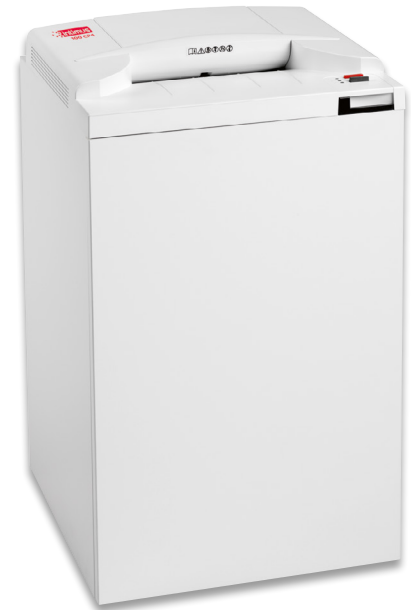
A/P/H 49 x 44 x 90 cm