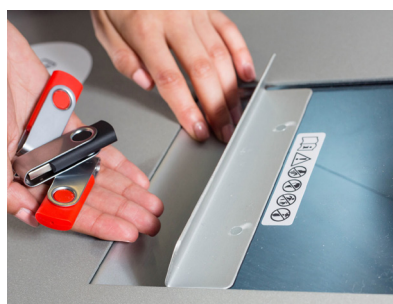
Les disques SSD, les clés USB, les cartes SD et les cartes plastiques sont rendus inutilisables.