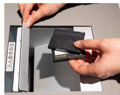
Les petites bandes magnétiques, ainsi que les CD, DVD et Blu-ray sont détruits.