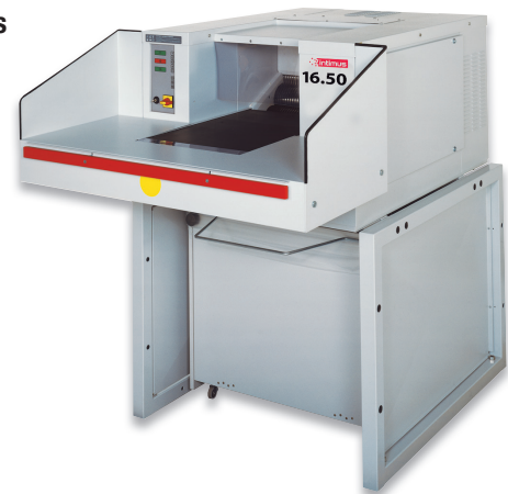
W/D/H 120 x 195 x 155 cm

Depuis des décennies, les destructeurs industriels intimus® sont des acteurs majeurs de la destruction des medias supports de données sur la vie privée. La gamme offre des modèles permettant de gérer jusqu'à 550 feuilles/h, comme des dossiers complets, en une seule opération. La grande table d'alimentation avec tapis roulant d'alimentation intègre un chargement contrôlé, sans effort, sûr et rapide. Le matériau ainsi détruit est recueilli dans des conteneurs mobiles ou pivotants de grande capacité au-dessous du mécanisme de découpe. Les combinaisons déchiqueteuse-presse sont couplées à une presse à balles pour un compactage entièrement automatique immédiat. L'effet de réduction par rapport à la réception sans compactage des découpes est d'environ 70 %.